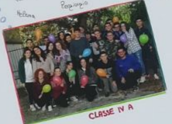
CLASSE IV A