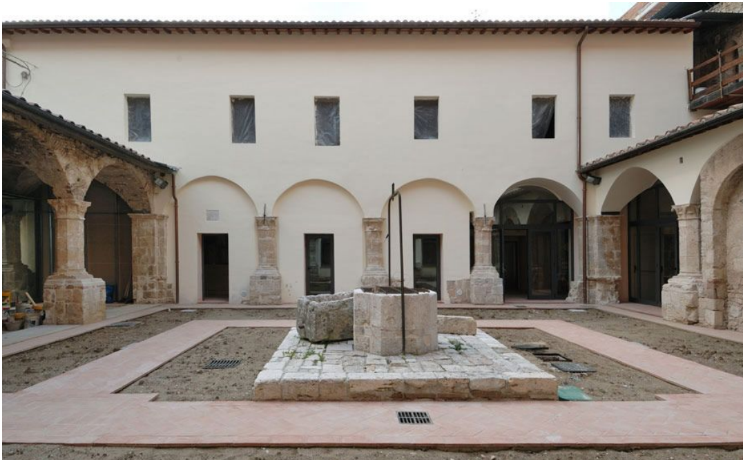
Ex Convento San Francesco in Acquasparta