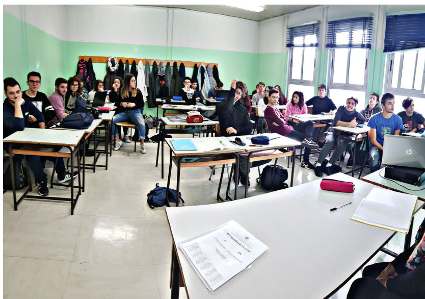
Immagine blog post

Il denaro restante verrà investito in altri due altri progetti.