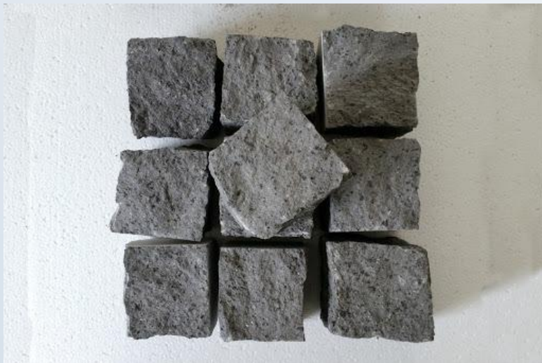
Sampietrini di colore nero