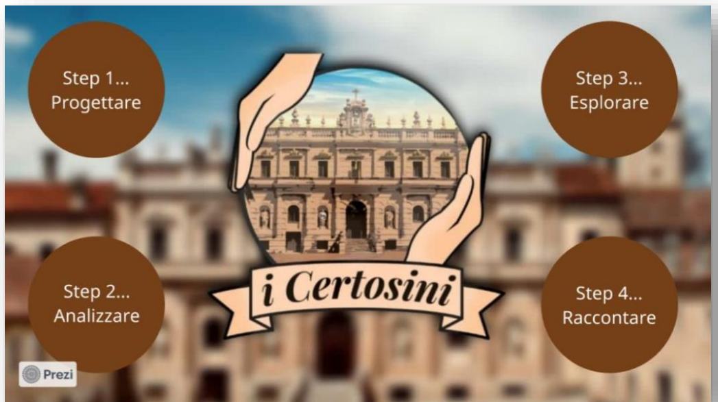
Immagine ASOC Wall:

Valorizzare il territorio per un futuro migliore.