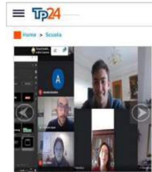
Marsala, i "Garibaldi's Watchers" a lezione di informazione digitale e video con Tp24